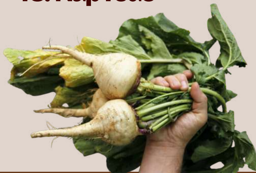
46. Nap redó