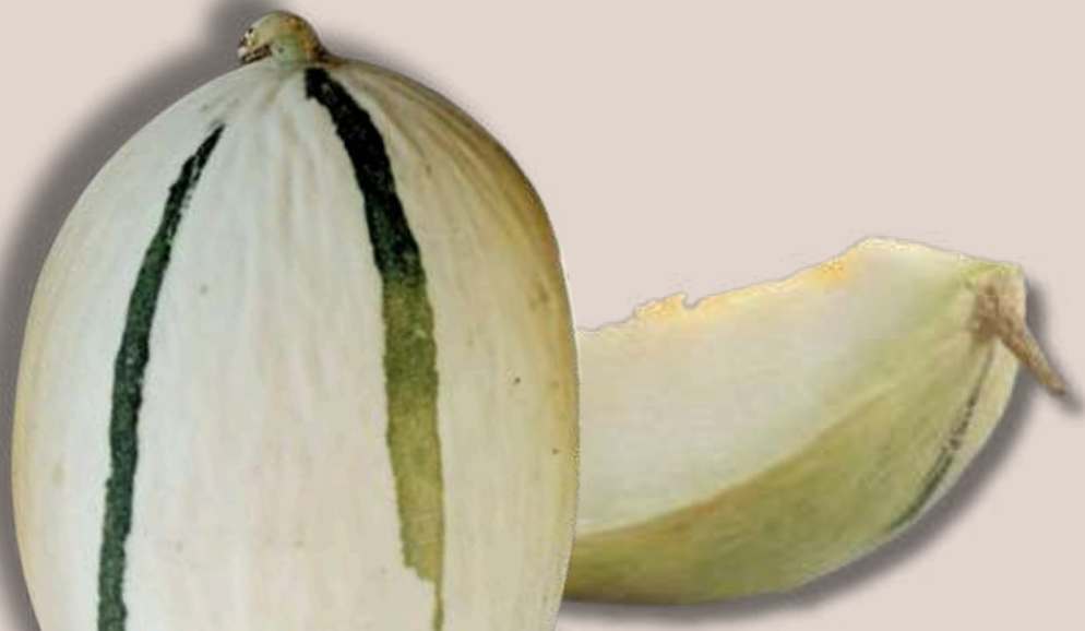
27. Meló blanc ratllat