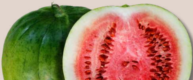
25. Meló d'Algèr pipa roja