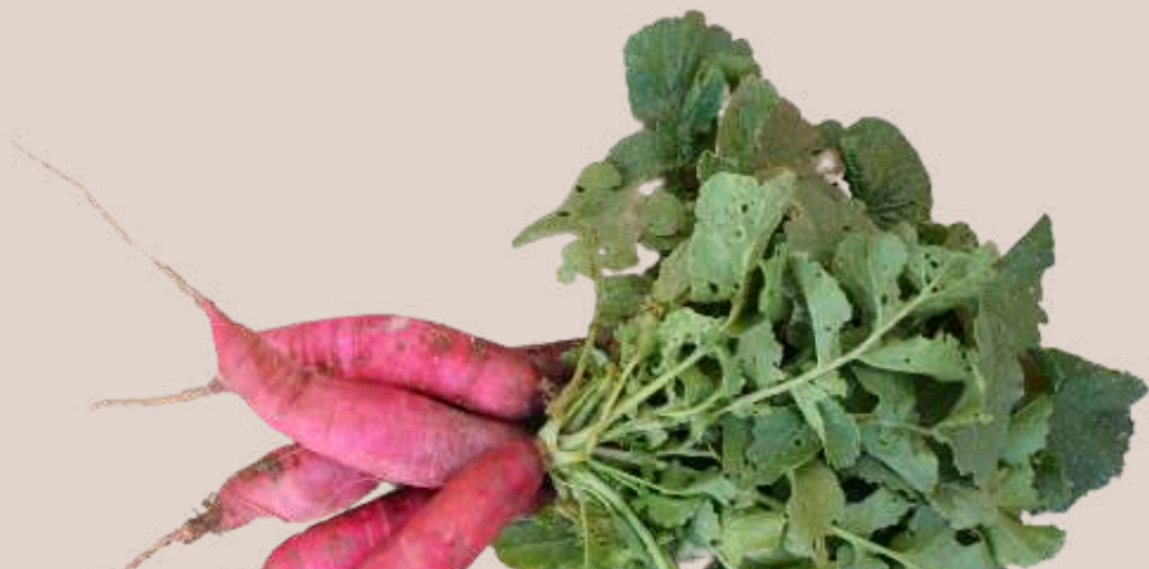
45. Rave roig