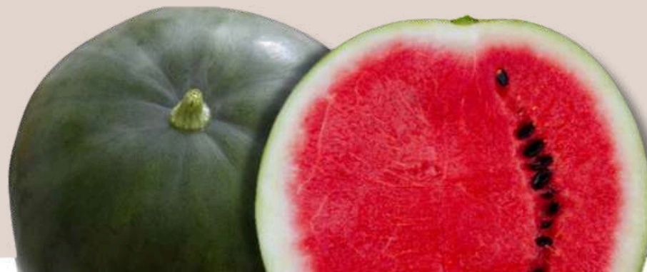
26. Meló d'Algèr sang de bou